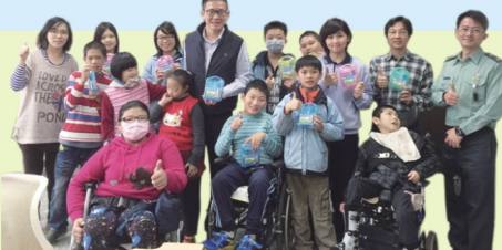
校長與家族同學到小學部送禮品與祝福合照

學生於校內熱情實踐本校和美六藝之生命力。本校高中部學生能深刻體會施比受更有福的道理，除了平時會協助特教部學生潔牙、推輪椅到餐廳用餐服務外，更配合兒童節慶到教室進行關心與祝福，使校園更為友善、生命價值也更發光發熱。