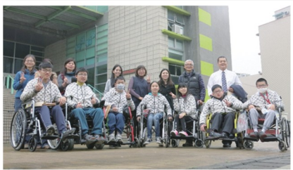
高職部商科於3月23日參觀勤益科大