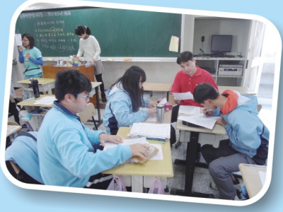
社會科引導學生討論二戰後的慰安婦議題