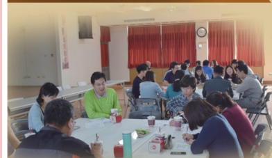
與會同仁在咖啡香中集思廣益，熱烈討論。

本校分別於104年11月17日、12月1日及105年1月8日召開「世界咖啡館校務發展匯談活動」，討論主題共分：教育團隊、學生學習、國際接軌、學校特色、計畫管理、校園管理等六大面向。藉由提供對話平台，匯聚智慧，凝聚共識，廣納學校教師各專業領域的多元觀點，對校務發展產生新的想像，尋覓新的行動契機，以實現「多元融合、合鞋專業、精緻統整、創新卓越、全人優質」之學校願景藍圖。