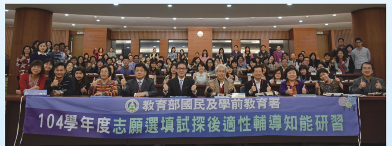
志願選填試探後適性輔導知能研習全體學員大合照