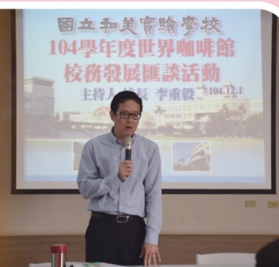
校長進行開場，並闡述辦理世界咖啡館校務發展匯談活動之用意與方向

本校分別於104年11月17日、12月1日及105年1月8日召開「世界咖啡館校務發展匯談活動」，討論主題共分：教育團隊、學生學習、國際接軌、學校特色、計畫管理、校園管理等六大面向。藉由提供對話平台，匯聚智慧，凝聚共識，廣納學校教師各專業領域的多元觀點，對校務發展產生新的想像，尋覓新的行動契機，以實現「多元融合、合鞋專業、精緻統整、創新卓越、全人優質」之學校願景藍圖。