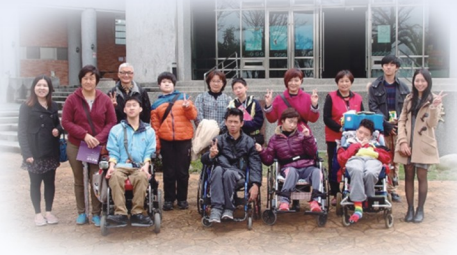
高職部美工科於3月16日參觀明道大學

為增進本校高職部學生對升學進路的認識，實輔處於3月16日(三)、3月23日(三)及4月27日(三)依據科別帶領高二師生前往明道大學—美工科、勤益科大—商科及嘉南藥理大學—家政科進行大專校院參訪，協助高二學生深入了解未來欲就讀校系及學群，提昇學生對大學校系課程及學習的認識，有助於學生選擇科系及規劃未來。