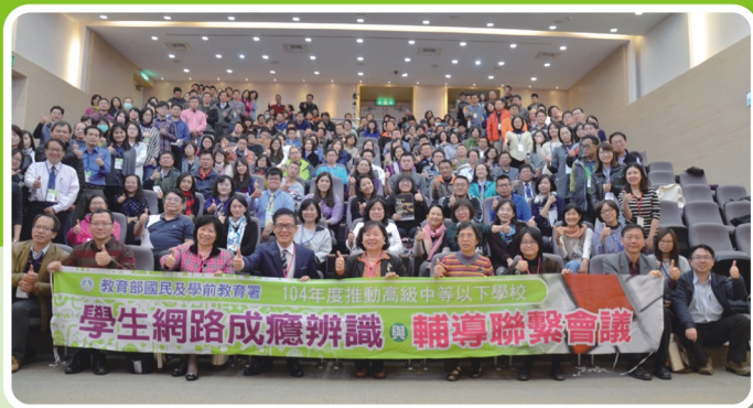
網路成癮辨識與輔導聯繫會議全體學員大合照