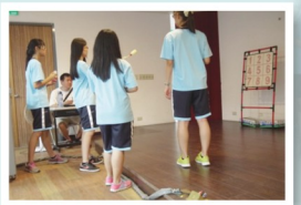
空氣砲擊破九宮格，看學生的瞄準後能否精準射中。