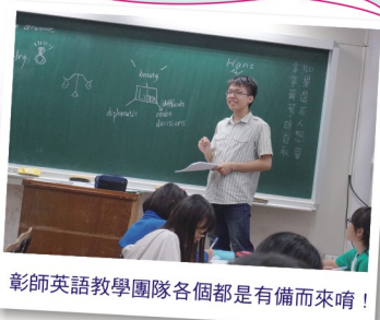
彰師英語教學團隊每個都是有備而來！

彰師大優秀的英語教學團隊藉由活動引導學生勇於在課堂上以英語表達自己的想法。首先以校園環境的介紹引起同學的注意，接著以星座、分組的形式讓主題討論可以更有效率地進行。飯店、慶生方式等提起學生的興趣，最後再以笑、愛情等主題讓學生可以多元表達自己的想法。學生在分組討論時由初始的羞赧，經過七天的薰陶後，漸能主動舉手發言了。