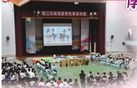
畢業班親師生齊聚一堂，離情依依

本校於6月12日辦理103學年度畢業典禮活動，主題為彩虹，主旨為透過多元生命融合與包容，產生繽紛色彩生命激盪，尊重並認識生命存在意義及價值，提升正向生活能量，勇於面對外來生活挑戰。