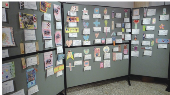
生命教育書籤作品展

另一個由影像與文字所構成的秘密花園。孩子的學習潛力無窮，只要我們能提供多元的展現空間，他們就像蛻變的蝴蝶，表現讓人驚艷。