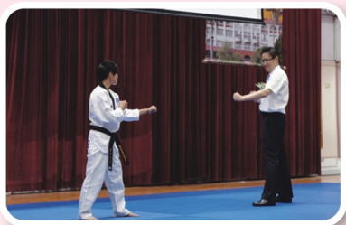
李校長與體育班學生PK