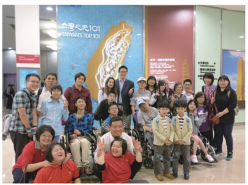
參與師生共同於開幕分享會合影

畫展為畫作展出的舞台，除使患者做畫的態度更顯積極達到正向發展並學習分享及合作，也讓社會大眾因了解腦性麻痺進而接納，基本理念，本校與中華民國腦性麻痺協會、國立台北啟智學校、國立文山特殊教育學校共同為腦性麻痺患者舉行畫展，讓腦性麻痺的創作有揮灑的天空。