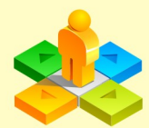
103學年度第2學期TQC電腦技能檢定榜單