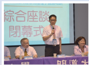
綜合座談—校長致詞