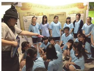
臺灣優格食品工廠有專業解說員說明公司的發展沿革及產品的製作。