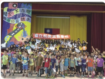
說明志工服務之意義

本校生輔組長帶領和美實驗學校赤道春暉社及友校員林高中康輔社與新民高中向陽春會社共計45人，於7月15、16日至田尾國小帶領國小學生藉由各項團康活動，將志工服務理念融入於每位同學心中，使整場活動充滿具有寓教於樂之氛圍。