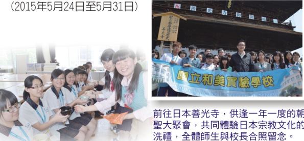
前往日本善光寺，供養一年一度的朝聖大聚會，共同體驗日本宗教文化的洗禮，全體師生與校長合照留念。

本校為拓展學生國際視野，提升學生學習認識不同文化，透過日本教育學校交流體驗他國教育教學情形，培養宏觀視野、陶冶人文素養及獨立學習的能力，邁向國際新紀元。(2015年5月24日至5月31日)