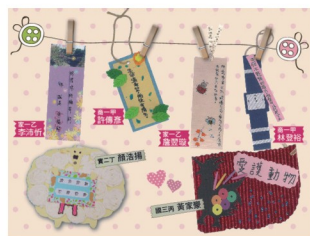
優選作品印製便條紙

另一個由影像與文字所構成的秘密花園。孩子的學習潛力無窮，只要我們能提供多元的展現空間，他們就像蛻變的蝴蝶，表現讓人驚艷。