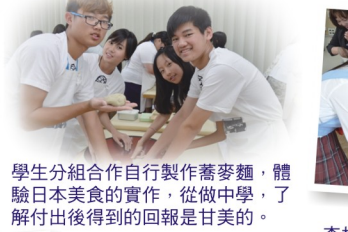
學生分組合作自行製作蕎麥麵，體驗日本美食的實作，從做中學，了解付出後得到的回報是甘美的。