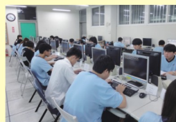
高中部學生參加TQC電腦專項技能檢定